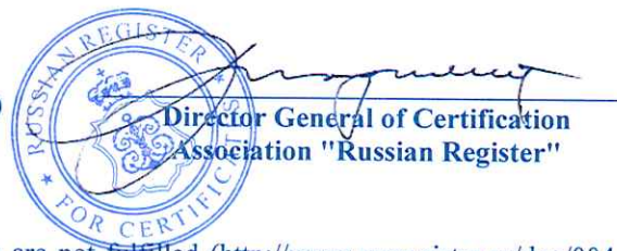
Director General of Certification Association "Russian Register"

This certificate is valid until 10 th November, 2019